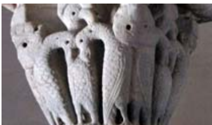
Mittwoch in der Karwoche: Jesus Christus – wie der Pelikan, der sich hingibt für die Seinen