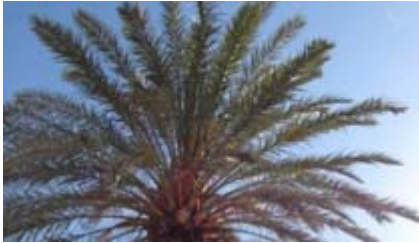
Palmsonntag: Jesus Christus – du kreuzt meinen Weg.