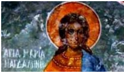
Ostersonntag: Das Leben nimmst du mit vom Grab