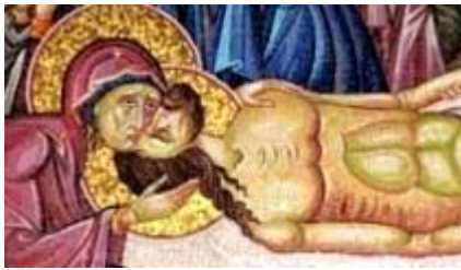
Karsamstag: Den Tod aushalten und hoffen