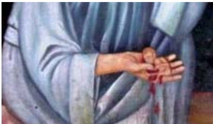
Montag in der Karwoche: Jesus Christus – Ich danke dir für deine offene Hand.