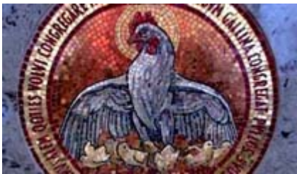
Dienstag in der Karwoche: Jesus Christus – für die Menschen wie eine Henne, die ihre Küken beschützt