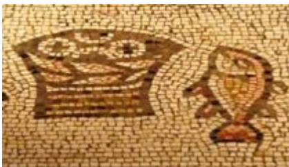
Gründonnerstag: Für alle, die Hunger und Durst haben.