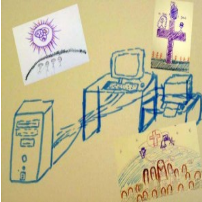
Bilder der Dreifaltigkeit